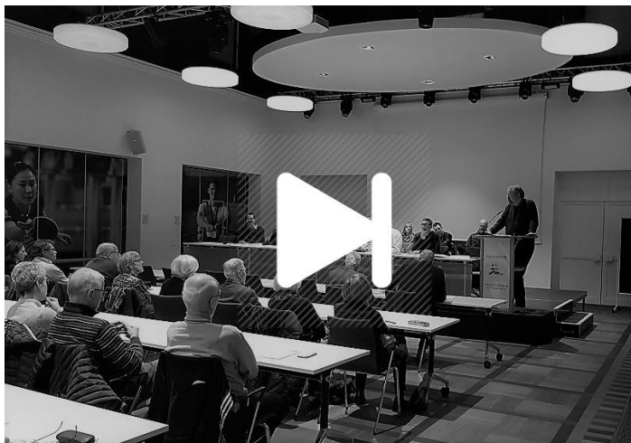
Die ordentliche Mitgliederversammlung muss verschoben werden.

Der traditionelle sportliche Abschluss des Jahres, unser Run&Jump, kann leider auch nicht wie gewohnt stattfinden. Derzeit wird geprüft, ob über die Landestrainer das Wettkampfformat zumindest als Kadermaßnahme an diesen Tag, dem 13. Dezember, durchführen können. Im positiven Fall werden wir diese Maßnahme mit unserer Expertise unterstützen.