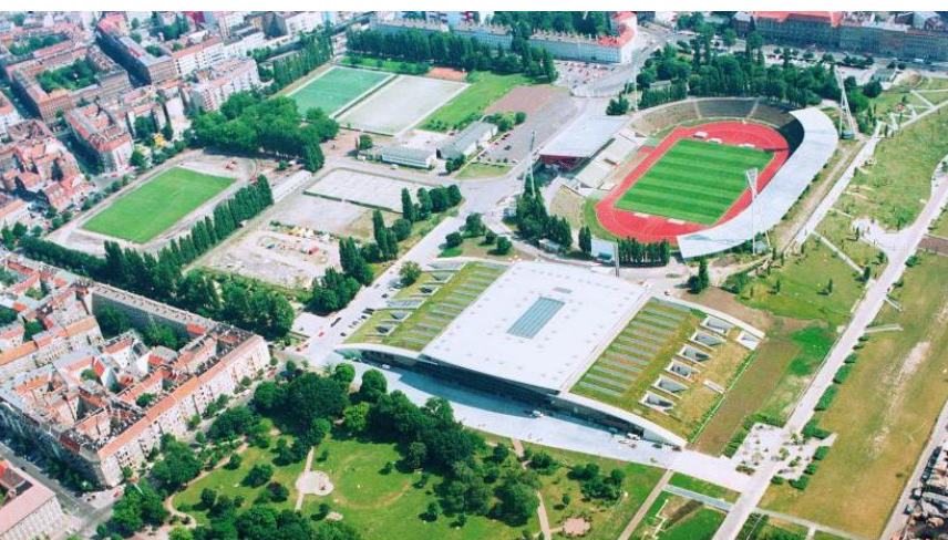
Zunächst keine Baumaßnahmen im Friedrich-Ludwig-Jahn-Sportpark

Das Projekt ‚Stadion für alle‘ liegt zunächst einmal bis auf weiteres auf Eis. Das gemeinsame Projekt des Landessportbundes Berlin, des Berliner Fußball-Verbandes, des Behindertensport-Verbandes und des Berliner Leichtathletik-Verbandes fand nicht die Unterstützung der Koalitionsfraktionen im Berliner Abgeordnetenhaus. Über ein ‚Werkstattverfahren‘ soll es einen mindestens zwei Jahre andauernden weiteren Diskussionsprozess zum Neubau des Stadions geben. Pläne zum Neubau gibt es bereits seit 2014. Eine