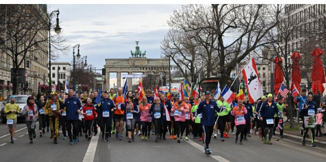
Traditioneller Jahresbeginn mit dem Neujahrslauf am Brandenburger Tor

Mitglieder der Abteilung mit entsprechender Mitgliedschaft haben die Anmeldeinformation am 16. November per Mail erhalten. Bitte beachtet den Anmeldeschluss am 18. Dezember 2023 .