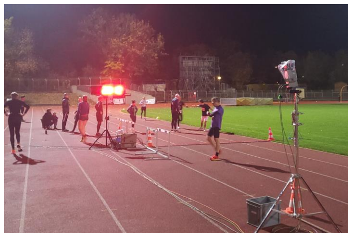
Dank der Technik eines Zeitmessdienstleisters gelang eine schnelle und korrekte Auswertung.